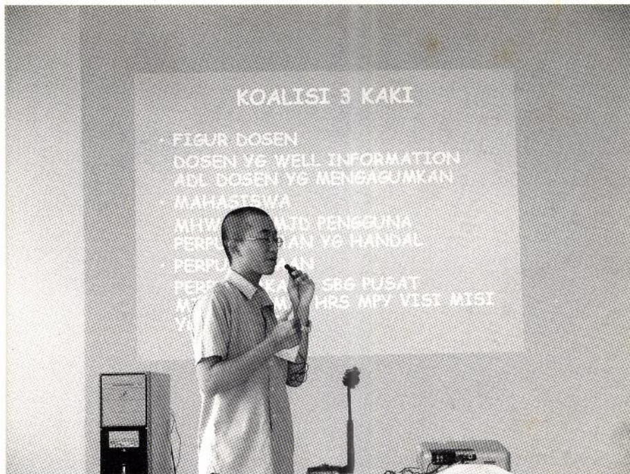
Salah seorang peserta lomba sedang presentasi