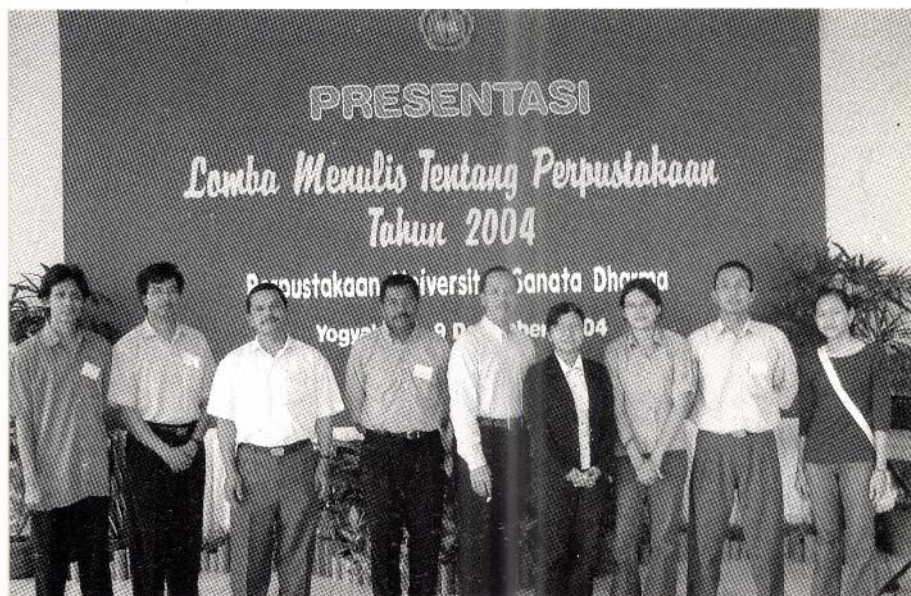
Peserta lomba dan dewan juri